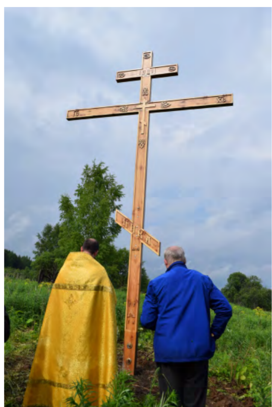
Лысьва, д. Грязнуха. Памятный крест, установленный благодарными потомками на Родине Пограничника №1 России Алексея Новикова.

ста Господня. И ныне мы с вами, братья и сестры возлюбленные, должны прикоснуться к Животворящему Древу нашими омертвевшими во грехах душами, дабы возгорелась в них жажда блаженного бессмертия. Мы призваны высоко воздвигнуть перед духовными взорами нашими Честной Крест Господень и поклониться Ему, дабы даровано было нам прозрение и избавление от наваждений бесовских. «Не образу только Христа Бога поклоняйся, но и образу Креста Его, потому что он есть знамение победы Христовой над дьяволом», – говорит святитель Иоанн Златоуст. Образ Животворящего Креста Господня сопутствует православному христианину во всей его жизни. Знамением Креста мы молитвенно осеняем себя, этот святой образ мы носим на груди, созерцаем его и поклоняемся ему в наших храмах, он же возносится над нашими могилами – знаком нерушимого христианского упования на Воскресение в жизнь вечную.