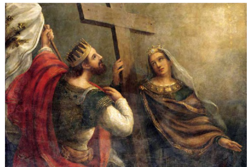
Святой равноапостольный царь Константин и Святая царица Елена. Николай Аполлонович Майков. Около 1835 г. Холст, масло. Государственный Русский музей, С.-Петербург.

Лысьвенское благочиние Адрес: г. Лысьва, ул. Революции 2 «А» Телефон: 3-61-12 Сайт: http://svtroitsa-gram.ru ВК: Свято-Троицкий храм. Лысьва