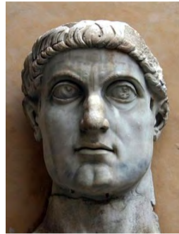
Святой равноапостольный император Константин Великий. Фрагмент капитолийского колосса (статуи императора Константина). Капитолийские музеи. Двор Плаццо деи Консерватории.

Попуская гонения для прославления и укрепления молодой Церкви, Правосудный Господь не оставлял без кары Ее гонителей. Вечным мукам, ожидающим за порогом смерти императоров-изуверов, предшествовал обычно плачевный конец их земного правления. Развратный Нерон, зачинатель гонений, был свергнут с престола и убил сам себя. Домициан был убит заговорщиками, а Декий убит неприятелями и тела его никто не нашел. Император Валериан, попав в плен к персам, был вынужден исполнять унизительную службу: подставлять свою спину под ноги персидскому царю Шапуру, когда тот садился на лошадь. Затем, после того, как Валериан предложил царю огромный выкуп, царь Шапур убил его, влив ему в рот расплавленное золото. После смерти Валериана с него содрали кожу и сделали чучело, набив соломой. Диоклетиан лишился рассудка и уморил себя голодом. Максимиан Геркулий и Максимиан покончили с собой при помощи яда. Галерий был поражен ужасной болезнью, от которой тело его начало издавать такой смрад, что даже врачи не могли к нему приблизиться. Между тем император Констан-