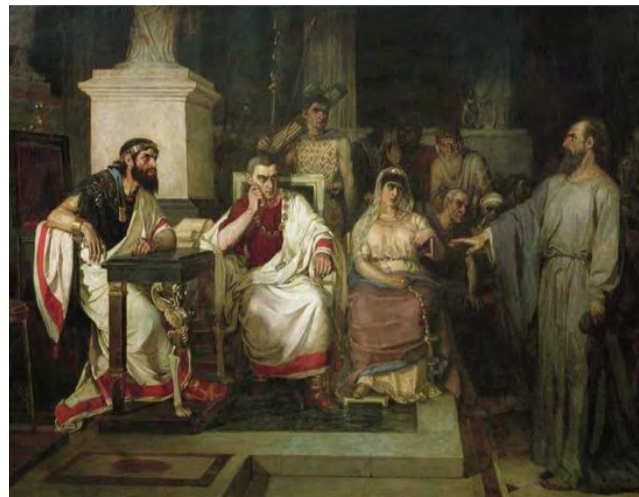
Василий Суриков. «Апостол Павел объясняет догматы веры в присутствии царя Агриппы, сестры его Береники и проконсула Феста». Холст, масло, 1875 год, Государственная Третьяковская галерея, Москва, Россия.

От природы одаренный Павел после встречи с Воскресшим Христом на пути в Дамаск