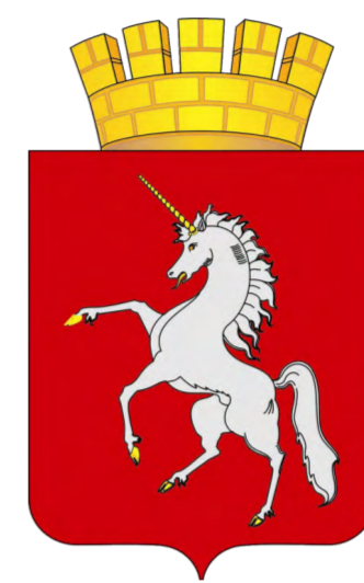
Герб Лысьвенского городского округа.

тийских летописей, в западном христианстве единорога обычно изображали рядом со святыми девами – в знак их непорочности. На Руси также нашлось место для этого мифического существа. Начиная с Ивана Третьего и вплоть до Петра Великого единорог был