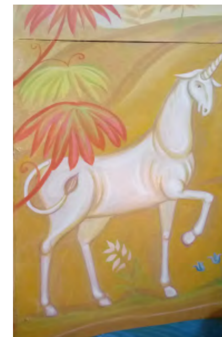
Единорог в храме Всех святых. Верхне-Чусовская Казанская Трифонова пустынь. Чусовской район. Часть настенной росписи. Работа члена Союза художников России Натальи Бортовой.