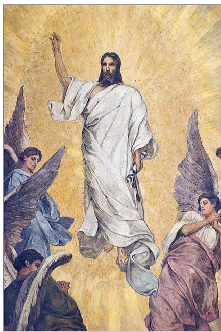
Вознесение Христа. Художник Павел Александрович Сведомский. Фреска, Владимирский собор, Киев.

До Христа люди не умели ценить человеческой личности. Христос и Евангелие первые провозгласили единственность, неповторимость, драгоценность для Бога каждой человеческой личности, каждого человека, и это откровение, это откровение стало менять всю обстановку и древнего и последующего мира. Если теперь среди людей есть понимание человеческой личности, если к ней есть уважение, если мы друг на друга смотрим и думаем, понимаем, что мы — перед единственным человеком, неповторимым человеком, для которого стоит жить и жизнь отдавать, то это — по слову, по учению и по обра-