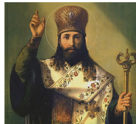
Тихон (Соколов), епископ Воронежский и Елецкий, Задонский чудотворец, святитель (1724–1783).

только скорбями, но и многими скорбями... внити туда подобает. В-четвертых, глас оный Отчий: Сей есть Сын Мой Возлюбленный, о Немже благоволил: Того послушайте, — не только апостолов, но и нас всех касается. Тогда возглашал Бог из облака апостолам, но через них и к нам сей глас дошел; и к нам глаголет Бог: Сей есть Сын Мой Возлюбленный, о Немже благоволил: Того послушайте! Сколько раз читаем или слышим Евангелие Его святое, столько раз слышим глас Сына Божия, глаголющий к нам, Который не о чем ином поучает нас, как о спасительном пути, которым до славы оной Божией, на горе святой отчасти показанной, должно всякому идти, кто хочет получить оную. И кто слову Божию не внимает, тот не человеку не внимает, но Самому Богу; и кто слово Божие не слушает, и по слову Божию не живет, тот Бога не слушает, Который через слово Свое глаголет. Послушаем же Сына Божия, как увещевает нас Небесный Отец, и, мирские прихоти оставив, возьмем всяк крест свой, какой от Него наложен будет, и пойдём за Ним, да приведет нас к Небесному Своему Отцу; тако потечем, да постигнем; постраждем с Ним, да и с Ним прославимся; не постыдимся поношение Его носить, да и Он не постыдится нас, когда придет во славе Своей. Да помянет нас Господь во Царствии Своем!