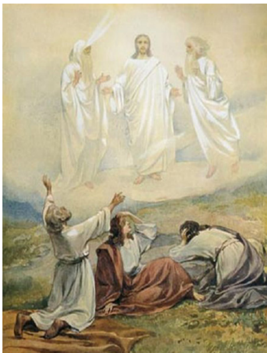
Худ. Клавдий Лебедев. Преображение Господне.

Когда видение еще продолжалось, один из учеников, Петр, сказал: «Господи! хорошо нам здесь быть; если хочешь, сделаем здесь три кущи: Тебе одну, и Моисею одну, и одну Илию», — ибо Моисей и Илия явились Иисусу и беседовали с Ним об исходе Его, т. е. о Его крестной смерти (Мф. 17:1-9). Слова апостола Петра были естественной реакцией человека на присутствие Божие, на Его внезапное явление, на неожиданное, светоносное посещение свыше. «Хорошо нам здесь быть», — т. е. хорошо бы, чтобы все это продолжилось, чтобы этот момент славы, света никогда не кончался. Но после восшествия