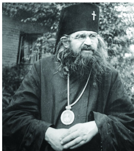
Святитель Иоанн (Максимович). Епископ Русской православной церкви заграницей; архиепископ Западно-Американский и Сан-Францисский. Миссионер, проявлявший, по свидетельствам его почитателей, случаи прозорливости и чудотворения.

Посему эта борьба мучительна, но она необходима для приближения к Богу.